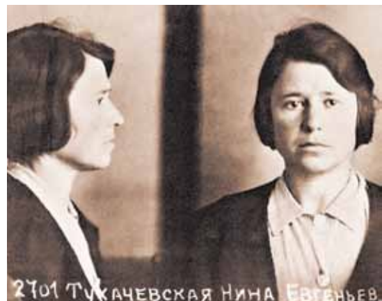
фото из архивного следственного дела

линских репрессий, видна четкая тенденция: убирали всех тех, кто мог представлять (или Сталину казалось, что представляют) опасность для его единоличной власти. Бухарин, Каменев, Зиновьев... В 1937-м пришла очередь военных. Причем военных популярных и уважаемых со времен Гражданской.