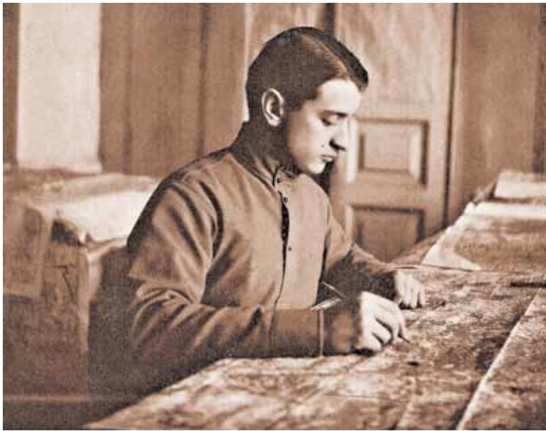
Михаил Тухачевский (не позднее 1923 г.)

лее что и воевали они на одной стороне в Первую мировую. Заметим: именно в плену, куда попадала агитационная литература, Тухачевский всерьез увлекся идеями большевиков.