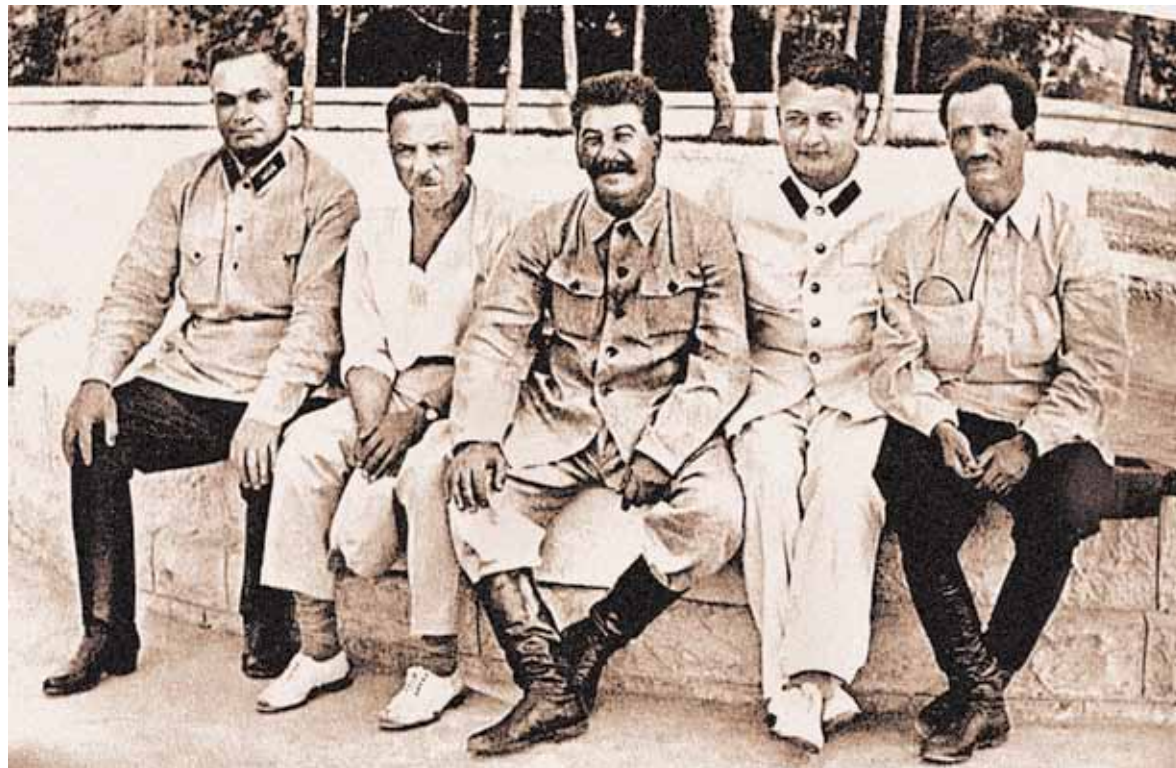
Егоров, Ворошилов, Сталин, Тухачевский, Лакоба. На юге, 1933 год.

Еще одна непростая сфера: Советская Россия и Германия в конце 1920-х активнейшим образом сотрудничали. На территории СССР были совместные советско-германские военные школы: например, танковая школа под Казанью, летная – в Липецке, школа химической войны под Саратовом... Тухачевский, будучи высокопоставленным военачальником, принимал непосредственное кураторское участие в этих контактах. Это прослеживается и по нашим, и по немецким документам. При этом нелюбовь к Германии у него была уже выпестована. Во-первых, он воевал против немцев, находился у них в плену. Безусловно, все это ушло с ним и в зрелую жизнь. Совершенно понятная и объяснимая подозрительность. Некое предубеждение, вернее, предчувствие, основанное на знаниях, – как показали 1930-е, совершенно правильное. Это тоже очень важный момент. Информация, полученная во время этого сотрудничества, могла бы весьма пригодиться нашей стране в конце 30-х, в предвоенное время.