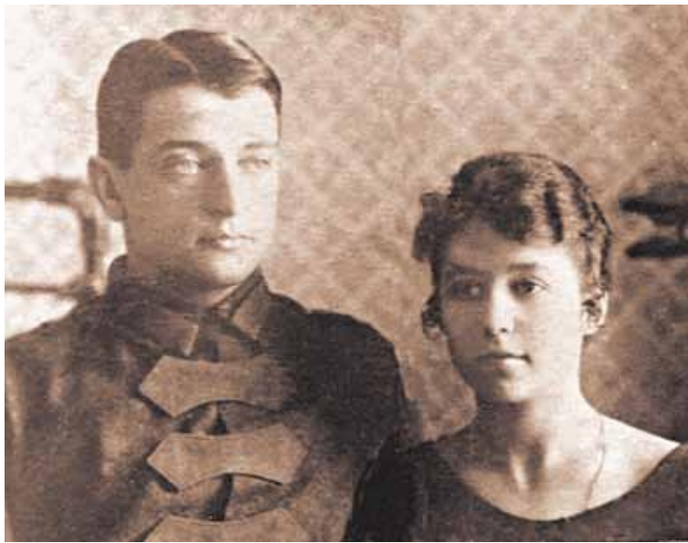
Михаил Тухачевский с женой Ниной, 1921 г.