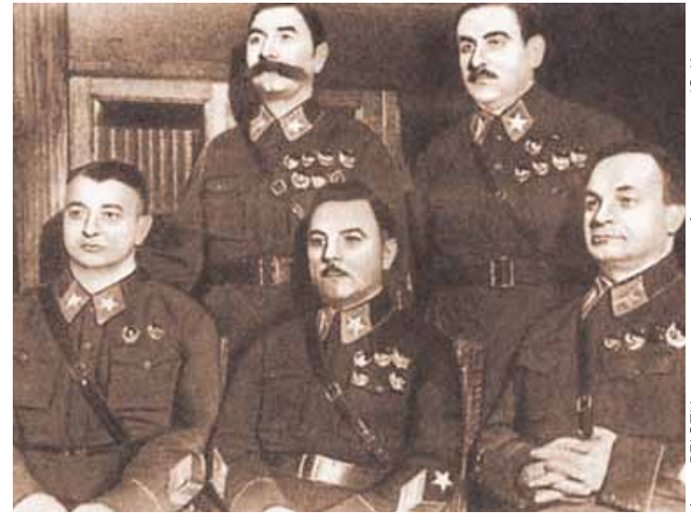
Январь 1936 г. Первые маршалы СССР: Тухачевский, Буденный, Ворошилов, Блюхер, Егоров. Трое расстреляны

Тухачевский и в мирное время делал успешную карьеру, хотя она и была не вполне ровной. Создание Реактивного НИИ, где впоследствии были разработаны знаменитые «катюши», увлечение разработками химического оружия, модернизация вооруженных сил,