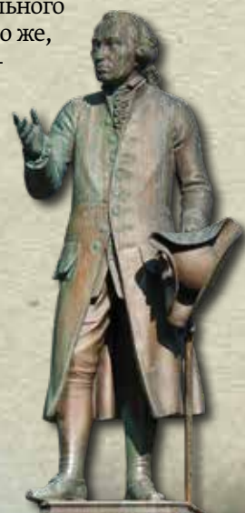
▶ Памятник Канту. Фото 2012 года

На основании Постановления Совмина СССР от 29 июня 1946 года «О запретной пограничной зоне и береговой пограничной полосе» был издан «совершенно секретный» приказ, предписывающий «в целях улучшения охраны границы в запретную пограничную зону включить всю Калининградскую область». Въезд в область и проживание в ней разрешалось только при наличии пропусков, выданных компетентными органами. Для перемещения по её территории недостаточно было местной прописки, нужен был ещё особый штамп в паспортах. Руководство Калининградского обкома 15 августа 1947 года «от имени трудящихся» обратилось в ЦК партии, призвав «сделать Калининградскую область крепостью Советского Союза на Западе» и, следовательно, ужесточить контрольно-пропускной режим, во избежание проникновения на её территорию «нежелательного элемента». В октябре оно же, не успокоившись на достигнутом, направило письмо министру госбезопасности Виктору Абакумову с просьбой дополнительно организовать «контрольно-пропускные пункты на пограничных станциях Эйдкунен и Советск (Тильзит)».