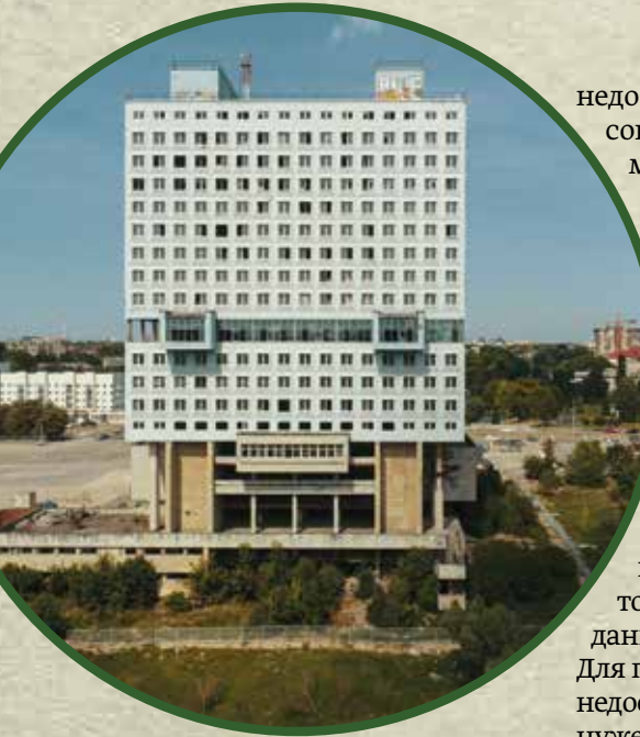
▲ Недостроенное здание Дома Советов в Калининграде. Фото 2018 года

Штурм также оставил на городе разрушительный след. Так что сохранилось здесь к окончанию войны очень немного. А вскоре после неё — почти ничего, поскольку в целях искоренения «прусского духа» планомерно разрушались старинные здания. Даже не тронутые войной особняки и виллы на городской периферии и в городках-сателлитах разбирались по кирпичику и вывозились «для восстановления разрушенных советских городов». Не трогали в основном лишь те, что были заселены военными, оставшимися в городе сразу после окончания войны, и первыми переселенцами (эти дома, естественно, стали густонаселёнными коммуналками). Но это в самом Кёнигсберге — Калининграде. А на периферии области разрушение происходило (и происходит), так