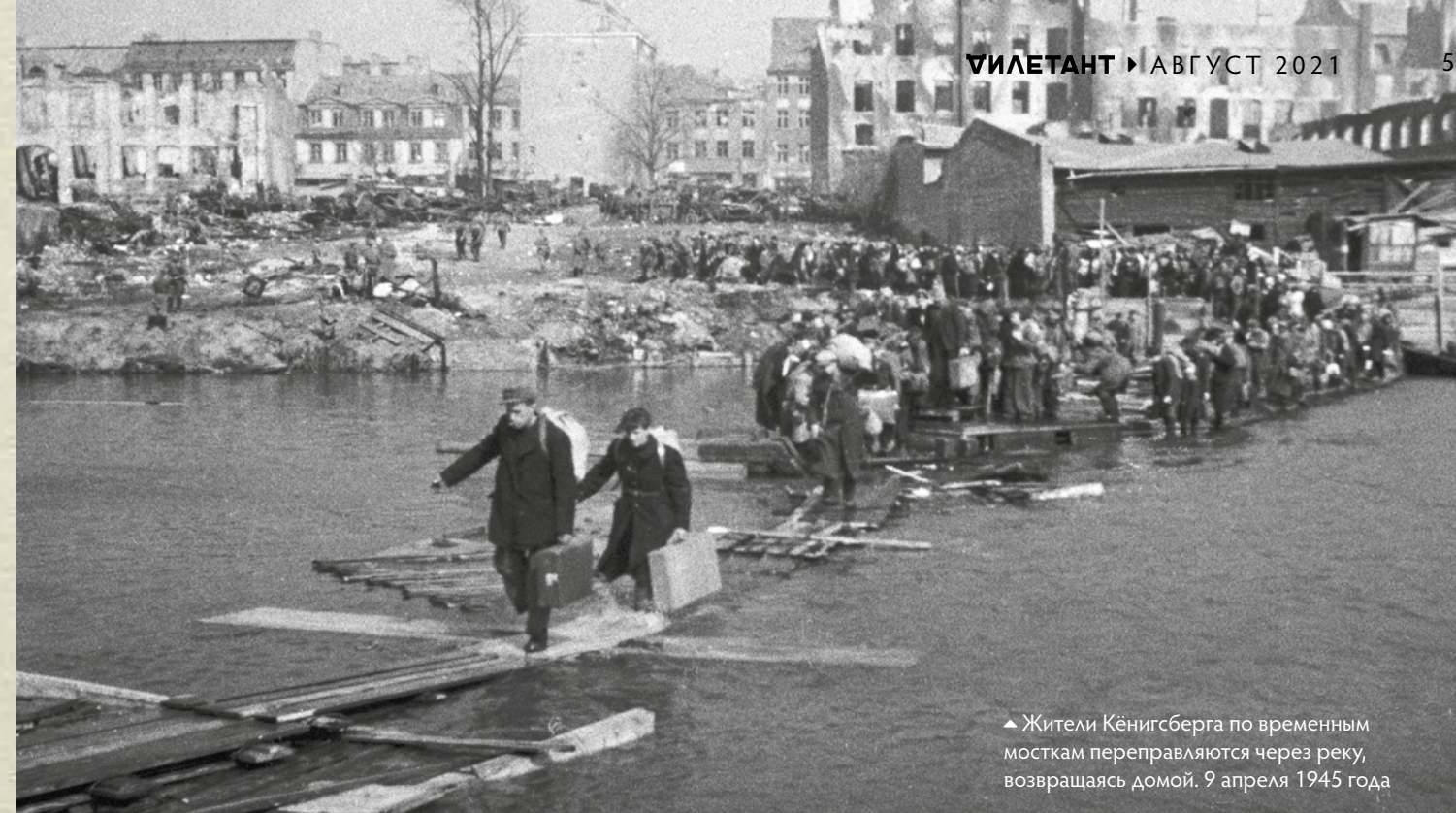
▲ Жители Кёнигсберга по временным мосткам переправляются через реку, возвращаясь домой. 9 апреля 1945 года

эшелоны вагонов-теплушек — с теми, кому предстояло обживать эти земли, искоренять ненавистный «прусский дух» и строить новую, советскую жизнь. С августа по октябрь 1946 года в область на добровольных началах переселилось двенадцать тысяч семей из центральных районов РСФСР, БССР и УССР. Всего в Кёнигсберге к концу войны (несмотря на несколько волн беженцев в 1944 — апреле 1945 годов) оставалось около 80 тысяч человек немецкого населения, в области — ещё примерно 50 тысяч, в подавляющем большинстве это были женщины, дети и старики.