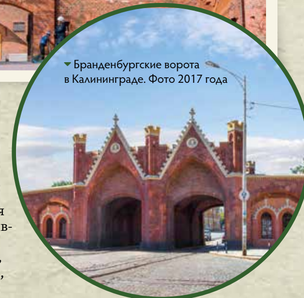
▼ Бранденбургские ворота в Калининграде. Фото 2017 года

Зеленоградск (бывший Кранц) также поражает обаянием средневековых улочек и элегантностью