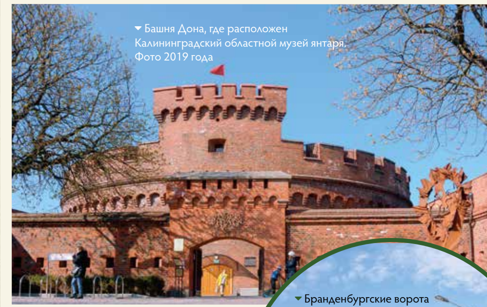
▼ Башня Дона, где расположен Калининградский областной музей янтаря. Фото 2019 года