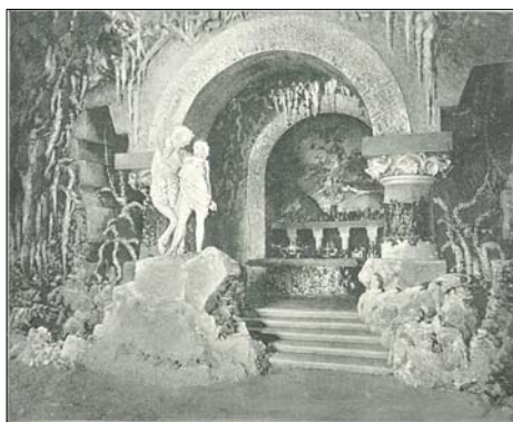
Павильон шипучих вин князя Голицына (внутренний вид)

Производство шампанского в дореволюционной России концентрировалось в руках привилегированного дворянства. Всего по классу шипучих вин «явилось с десятков экспонентов» 20 . Особый интерес вызвал Голицынский павильон, выстроенный по соседству с Императорским. «Здесь иногда происходила проба искрометного напитка,