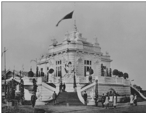
Павильон братьев Елисеевых

Представительство виноделов на выставке было еще более значительным, чем производителей водок и винокуров (количество экспонентов от виноделия превысило 100 предприятий) 9 . К концу XIX в. отечественное виноделие переживало стремительный подъем, связанный с усовершенствованием технологий производства вина и развитием новых виноградных хозяйств на юге страны (прежде всего, в Крыму и Средней Азии). Однако несмотря на это качество российского виноградного напитка было низким. «Наше виноделие начало подниматься только в последние 20–30 лет. Виноградного вина у нас всегда производилось много, но его выделка была так несовершенна, что потребители как бы стыдились его и предпочитали ему какую угодно иноземную бурду, лишь бы она была иноземная» 10 . Наиболее влиятельные виноделы и виноторговцы выстроили собственные выставочные павильоны. Особенно удачным оказался павильон столычных купцов Елисеевых. «О беленьком, прелестном павильоне Елисеевых, с небольшим погребом под ним мы уже говорили, а об изделиях этой фирмы нечего распространяться, ибо она очень коротко известна на Руси всем и каждому» 11 . Заслуживают упоминания вина генерала М. Н. Анненкова, выставленные в его павильоне, убранном азиатскими тканями. «Это — лучшие из наших азиатских вин, мягкие, нежные, вполне удовлетворительно отвечающие на все требования, какие можно