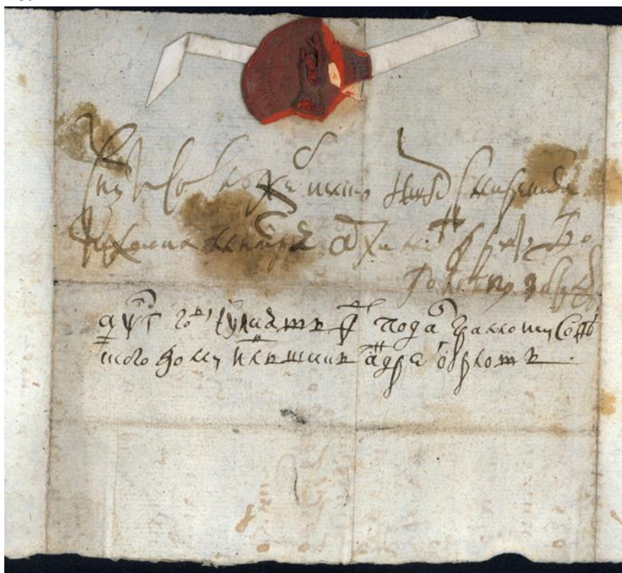
Ф. 132. Оп. 1. Карг. 53. Д. 135. Стг. 1 об. Фрагмент

Именной указ Петра I и распоряжение А.Д. Меншикова о сборе работников на городское строительство до наших дней не сохранились. Однако в архивах новгородских монастырей, хранящихся в СПбИИ РАН, имеются документы, раскрывающие историю организации сбора работных людей и повседневной жизни первых гражданских строителей Санкт-Петербурга. Один из них — указ митрополита Иова архимандриту Тихвинского Успенского монастыря (от 5 июля 1703 г.) быть послушным капитану П.С. Глебовскому («или кто с приказные полаты к вам в монастырь и в монастырские ваши вотчины... приедут») — представлен на виртуальной выставке.