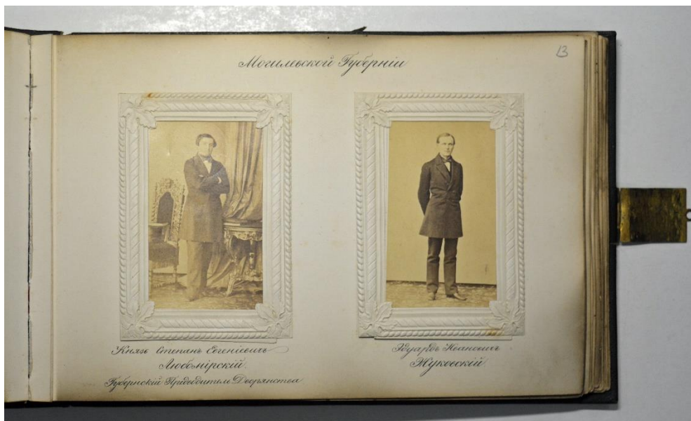
Депутаты губернских дворянских комитетов по крестьянскому делу второго приглашения в Петербург 1860 года. Альбом (Архив СПбИИ РАН. Ф. 195 (Минины). Оп. 1. Д. 67. Л. 13)