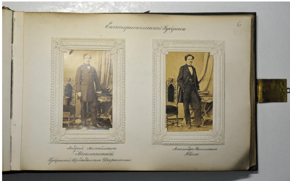
Депутаты губернских дворянских комитетов по крестьянскому делу второго приглашения в Петербург 1860 года. Альбом (Архив СПбИИ РАН. Ф. 195 (Минины). Оп. 1. Д. 67. Л. 6)