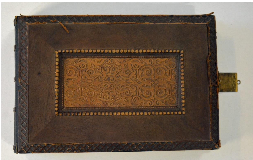
Депутаты губернских дворянских комитетов по крестьянскому делу второго приглашения в Петербург 1860 года. Альбом