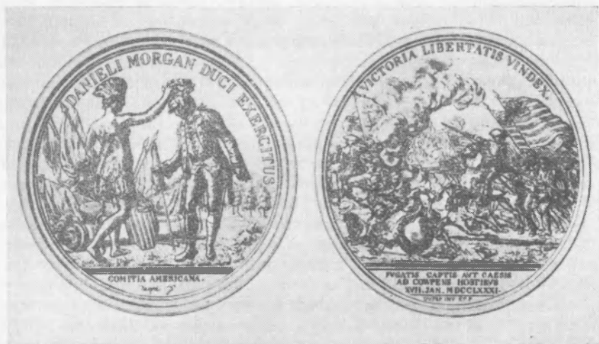
Рис. 2. Медаль в честь Д. Моргана ( Loubat J. F. The medallic history of the United States of America, 1776—1876. New York, 1878 ).

Дюпре был автором медали и в честь капитана Дж. П. Джонса. Описание медали было утверждено сессией Академии надписей