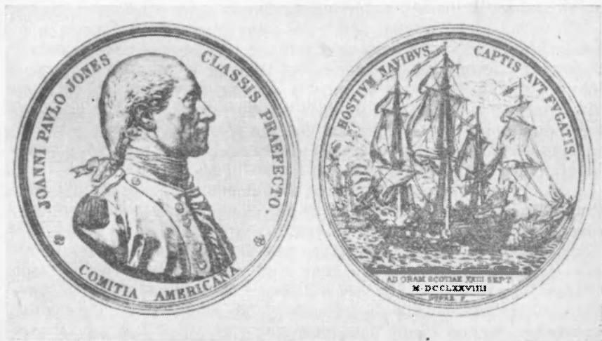
Рис. 3. Медаль в честь Дж. П. Джонса ( Loubat J. F. The medallic history of the United States of America, 1776—1876. New York, 1878 ).

Джонс проявлял живой интерес к изготовляемой в его честь медали. В августе 1788 г. он направил Джефферсону для передачи Академии надписей и изящной словесности отрывки из своего дневника, относящиеся к сражению у Фламборо Хед, и письмо. В письме он информировал американского посланника