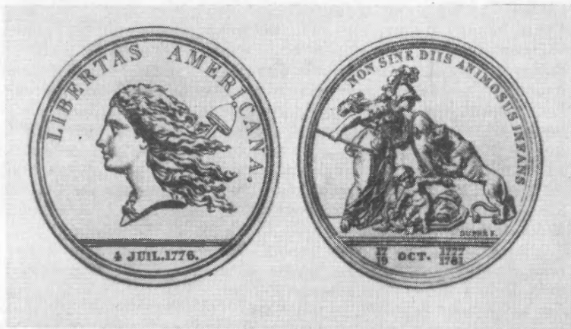
Рис. 4. Медаль «Американская свобода» ( Loubat J. F. The medallic history of the United States of America, 1776—1876. New York, 1878 ).

одно из наиболее удачных творений знаменитого французского медальера. 88 Энергичный, полный движения профиль «Свободы» был позднее использован для первых американских монет достоинством в один цент, отчеканенных монетным двором США в 1793—1795 гг. 89 Франклин считал эту медаль не только великолепным образцом медальерного искусства, но и прекрасным