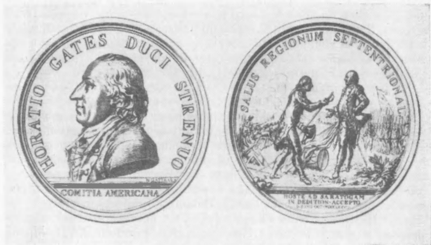
Рис. 1. Медаль в честь Г. Гейтса (Loubat J. F. The medallic history of the United States of America, 1776—1876. New York, 1878).

В поле реверса представлена сцена капитуляции английских войск при Саратогге. На переднем плане английский командующий генерал Бургойн отдает свою шпагу Гейтсу. На заднем плане слева побежденные складывают оружие и знамена, справа — американская армия в боевом порядке с развевающимися знаме-