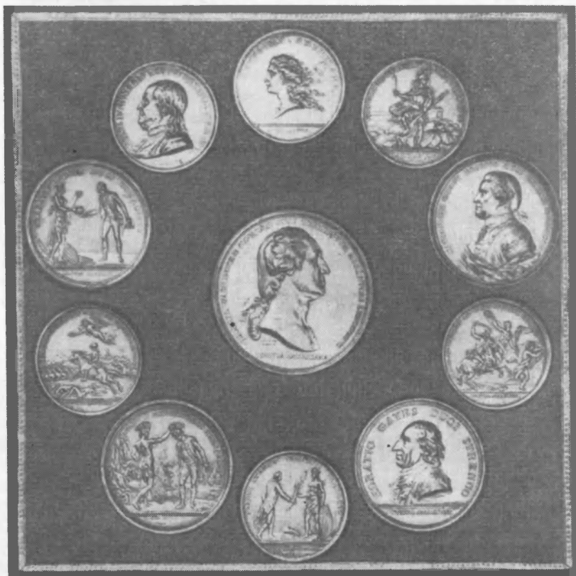
Рис. 6. Подарочный комплект памятных медалей Дж. Вашингтона (The papers of Thomas Jefferson : 20 vols / Ed. by J. Boyd. Princeton, 1950—1974; vol. 6).