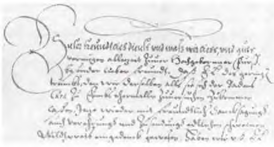
Рис. 5. Каллиграфический канцелярский курсив. Первая строка — канцелярское письмо. Письмо Иоганна, архиепископа Трирского, к Вильгельму, ландграфу Гессенскому. Вигтанх, 29 XI 1584 (Архив ЛОИИ ЗБС 2/439).

Продолжал оставаться очень распространенным тип сокращения, основанный на выпадении или обрыве г вместе с последующей или предыдущей гласной. Выпадение из середины слова происходило путем стяжения (Zusammenziehung). Например, пропуск -er- в слове unseren обозначался надписанным штрихом. Очень часты такого рода сокращения в словах: Herrn ( Hrn ), Marggraf ( Margg ). Обрыв (Abbrechung) распространенных в немецком языке окончаний -er, -en отмечался росчерком. Особенно характерны такие