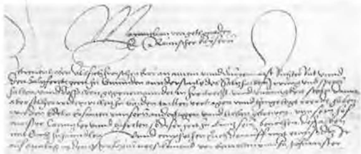
Рис. 2. Регуляризованный канцелярский курсив. Письмо германского императора Максимилиана I к судье и советнику Эиса. Липц, 10 IV 1514 (Архив ЛОИИ ЗЕС 9/448).

Буква с унаследовала от XV в. двухчастный дукт (с1). При этом верхний горизонтальный элемент ее служил связкой с последующей буквой. Стремление к беглости очень упростило эту форму в первой половине XVI в. Сначала отпадает нижний штрих, а затем и верхний горизонтальный элемент (с1 → с2 → с3). Остается лишь маленький вертикальный штрих с двумя волосными соединитель-