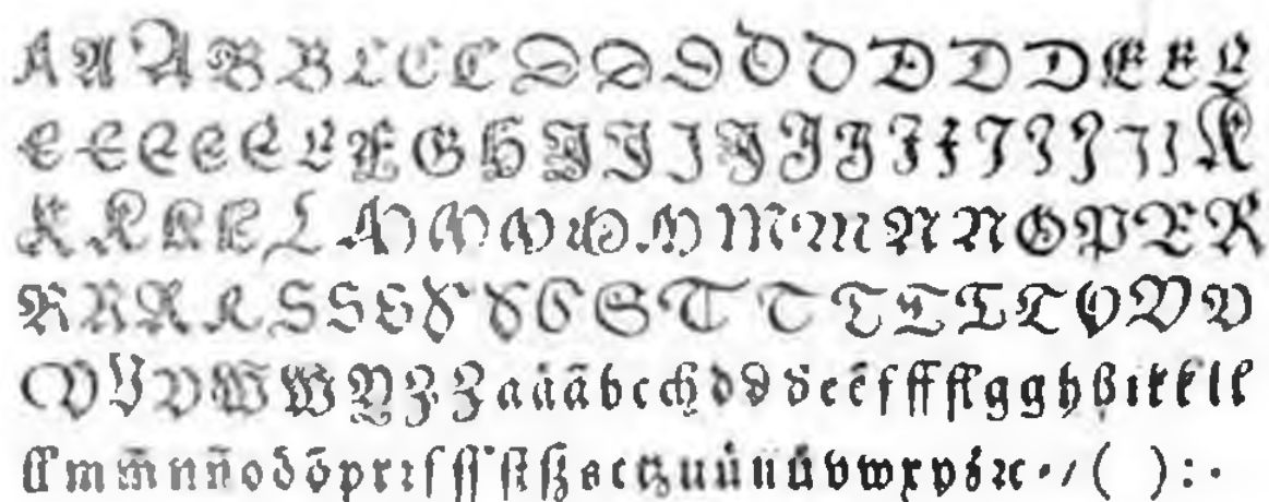
Рис. 1. Один из ранних образцов фрактуря, 1517, Аугсбург; воспроизведен по надписи: Cronia E., Kirschner J. Die gotischen Schriftarten. Leipzig, 1926, Taf. 62, Abb. 120.

Во втором десятилетии XVI в. в Германии уже существуют три классических для XVI—XVIII вв. вида немецкого письма. Первый и самый крупный из них — уже описанная фрактуря. Она употреблялась не только в книгопечатании, но и как письмо всякого рода торжественных надписей, подписей к картинам и т. п. В письме документов фрактуря применялась только для заголовков и нескольких начальных слов, определявших тему лица, от имени которого писалась та или иная торжественная грамота. В менее важных документах и этих случаях использовалось