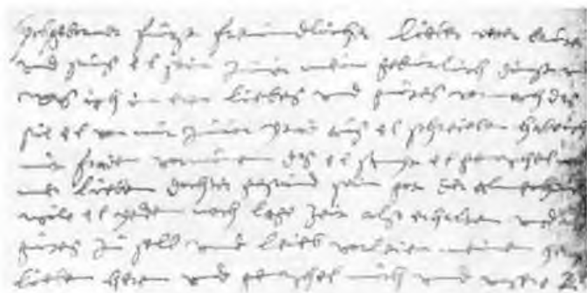
Рис. 4. Беглый курсив непрофессиональной руки. Письмо Анна Марии, герцогини Вюртембергской к брату, Штутгарт, 1568 (Архив ЮИИИ ЗЕС 3/421).

случаях предпочитается более простая форма г ломаного, хотя в письме XVI в. преобладало и прямое с расщепом или, например, вместо широко распространенной h — с длинной осью употребляется традиционная средневековая (см. рис. 4). Письмо пролаивает впечатление корявого и неуклюжего, зачастую буквы сильно растянуты, они очень крупные, по размеру значительный. Клязьма в большинстве своем не обладала должным практическим опытом