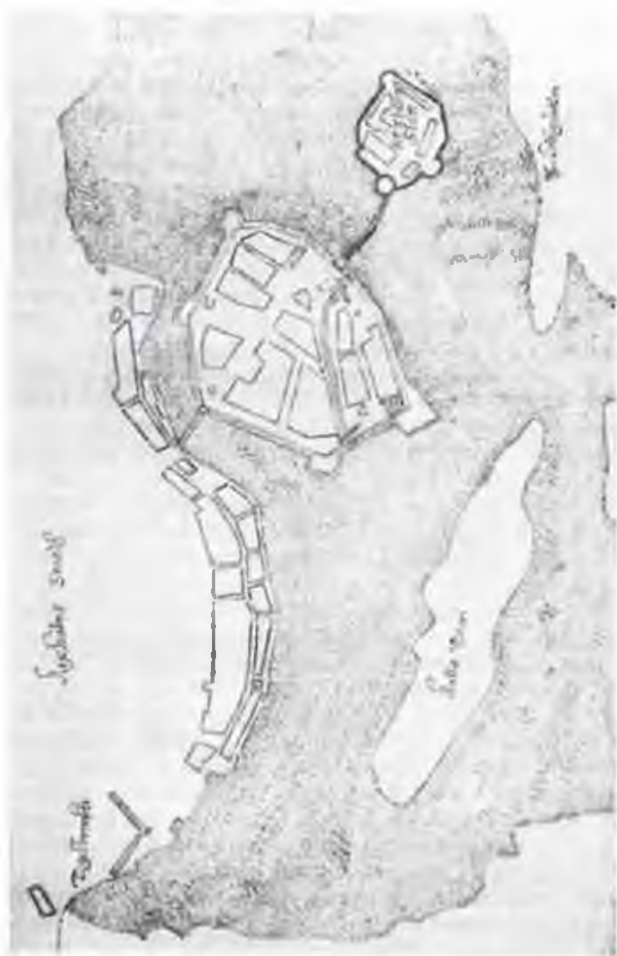
Рис. 2. Кексгольм — город и замок. План до пожара 1634 г. (Швеция, Гос. архив).