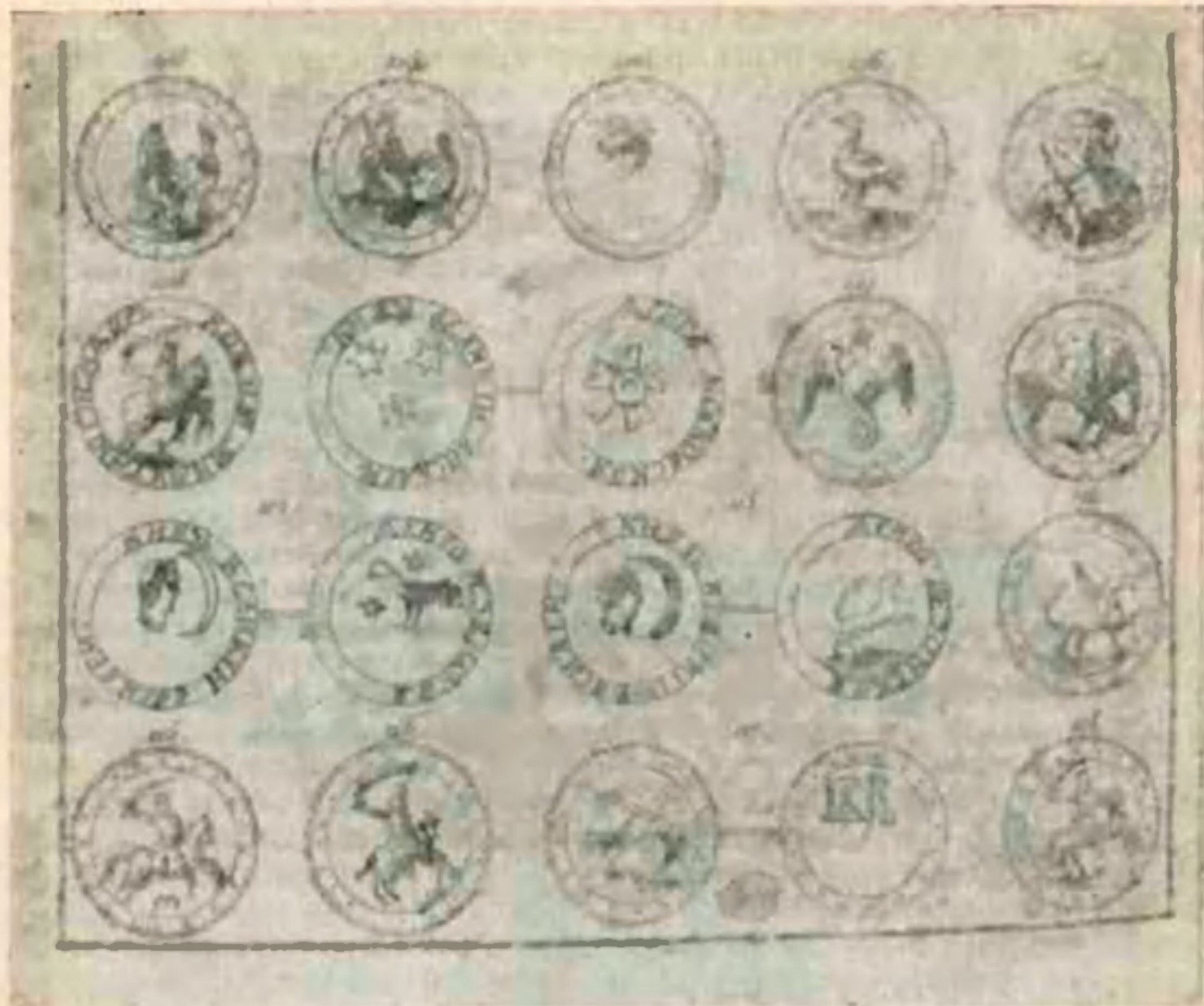
Рис. 4. Часть таблицы книги Леклерка с изображением монет альбома А. П. Остермани.

одного размера, каковы бы ни были по размеру и форме сами монеты. 22 Около некоторых из них обводилась подлинная форма монеты, как масштаб. Но без насилия над материалом Леклерк постарался соотнести рисунки остермановского альбома с текстом замечательной рукописи на латинском языке того же происхождения (т. е. из Кунсткамеры), озаглавленной «HISTORIA NUMISMATICA IMPERII RUSSICI», поскольку в ней имелись отсылки к померам рисунков.