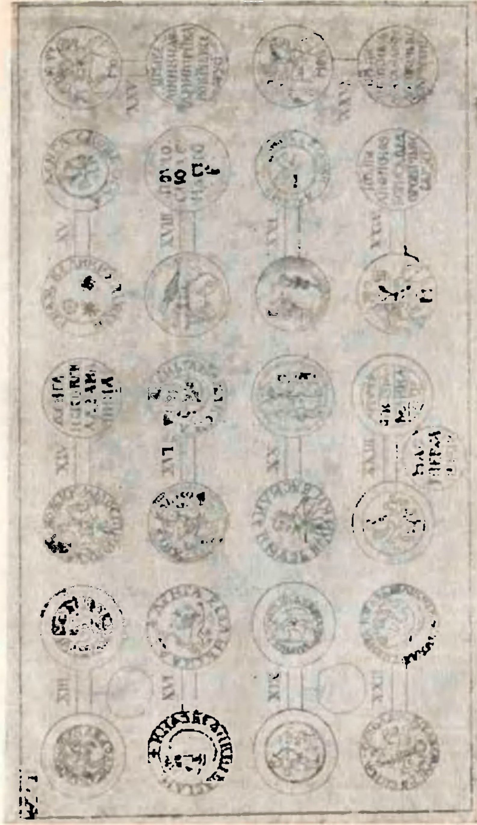
Рис. 6. Таблица — прило жено к кнп е Шм їдта 1777 г. Грле р Ап і о і Ан уст Б е с. Б жоуппейс.