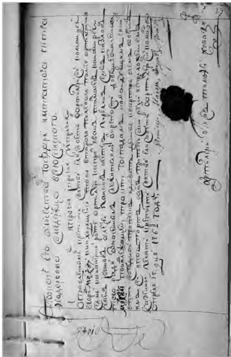
Рис. 1. Паспорт, изготовленный писарем Жмакиным, заверенный настоящей печатью Артиллерийской команды и поддельной подписью майора Геринга. Архив ВИМАИВиВС. Ф. 2. Оп. Кригсрехтерная. Д. 34. Л. 25