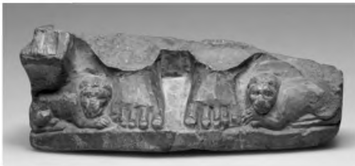
Рис. 2. Фрагмент рельефа со сценой «Даниил во рву львином». Известняк. V в. Государственный Эрмитаж (№ 11151)

Важную роль в выявлении сирийского типа композиции «Св. Даниил» играет григоровское серебряное блюдо X в. из собрания Эрмитажа. Как показали Н. В. Покровский и Я. И. Смирнов, 35 в основе композиции