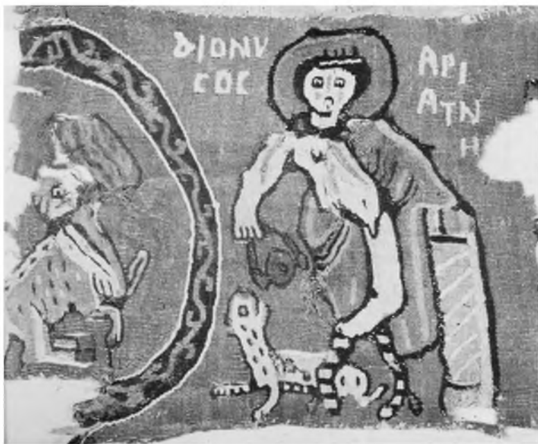
Рис. 2. Дионис. Фрагмент ткани. Египет. XIII—IX вв. Афины, музей Бенаки

греческими пояснительными надписями, начертанием очень схожими с теми, которые вытканы рядом с Диогеном и Лайсой (рис. 3). Геракл был, как уже отмечалось, почитаем Диогеном и самым непосредственным образом связан своими спасительными функциями с Дионисом и Ариадной, сопровождающей их свадебный кортеж, который запечатлен по меньшей мере на двух коптских тканях V в. 24