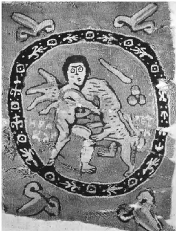
Рис. 3. Геракл, удушающий льва. Фрагмент ткани. Египет. VIII—IX вв. Афины, музей Бенаки

Объединительным мотивом мужских персонажей на афинской ткани, на мой взгляд, была присущая им любовная страсть.