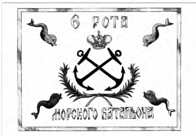
Рис. 3. Фурьерский значок 6-й роты морского батальона 1775–1778 гг.