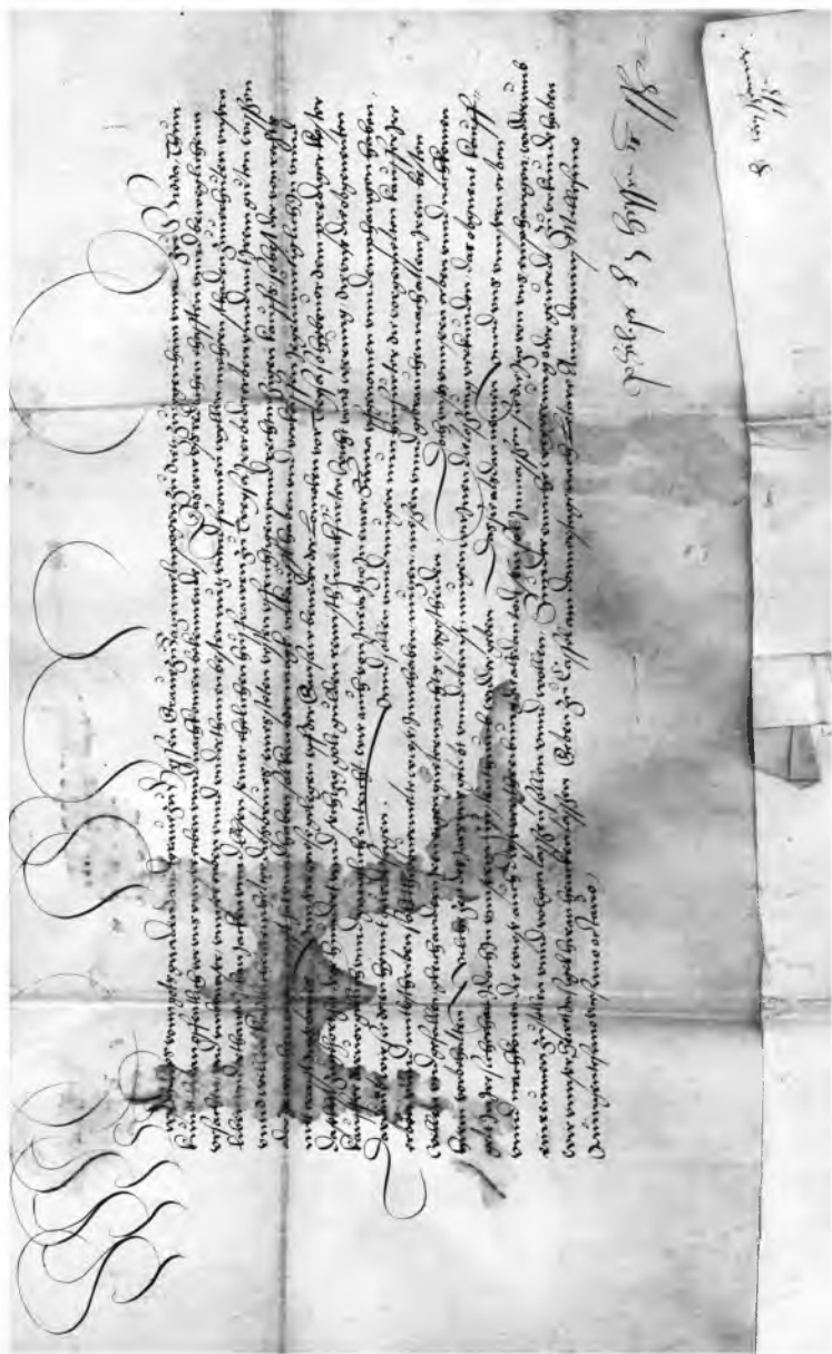
Рис. 1. Грамота ландграфа Гессенского Филиппа Великодушного. 26 марта 1528 г., Кассель. Архив СПбИИ РАН. ЗЕС. Колл. 25. № 2/423