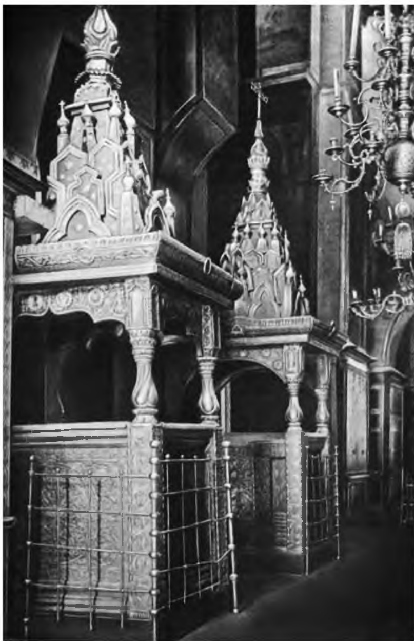
Ил. 3. Святительское и царское моленные места в Софийском соборе. Мастера Иван Белозерец, Евтропий Стефанов, Исак Яковлев (1560, 1570–1572).