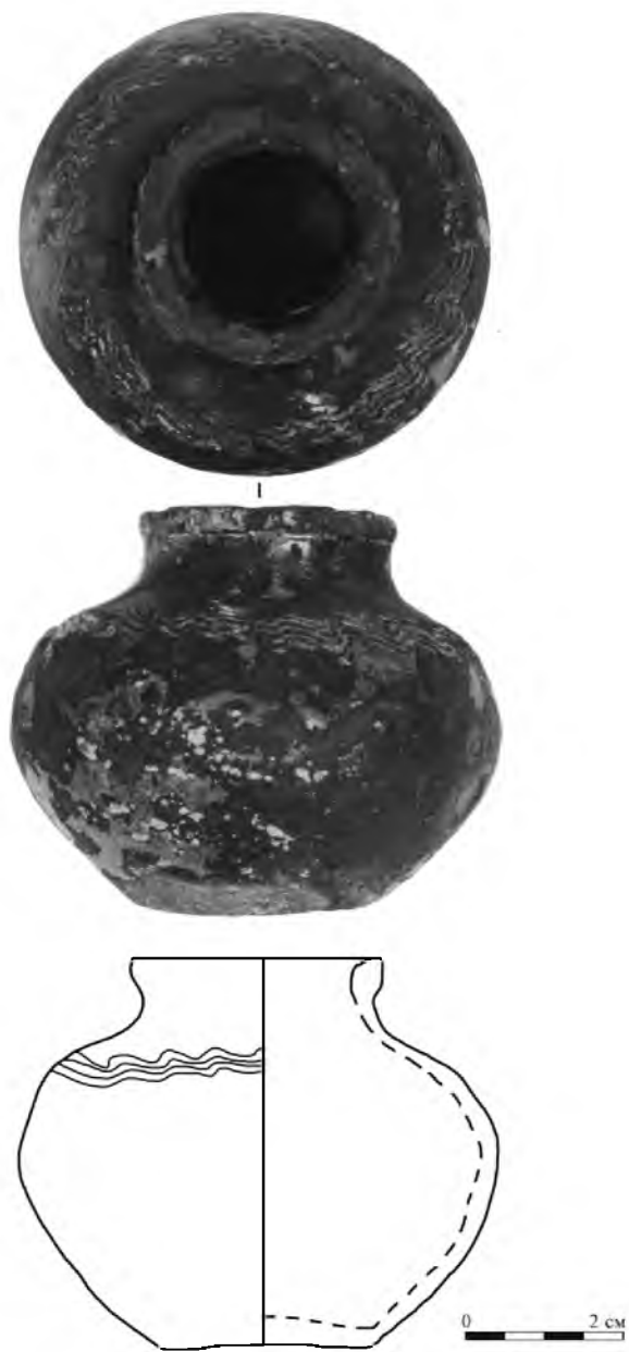
Рис. 1. Кладовый сосуд. Натуральная величина.