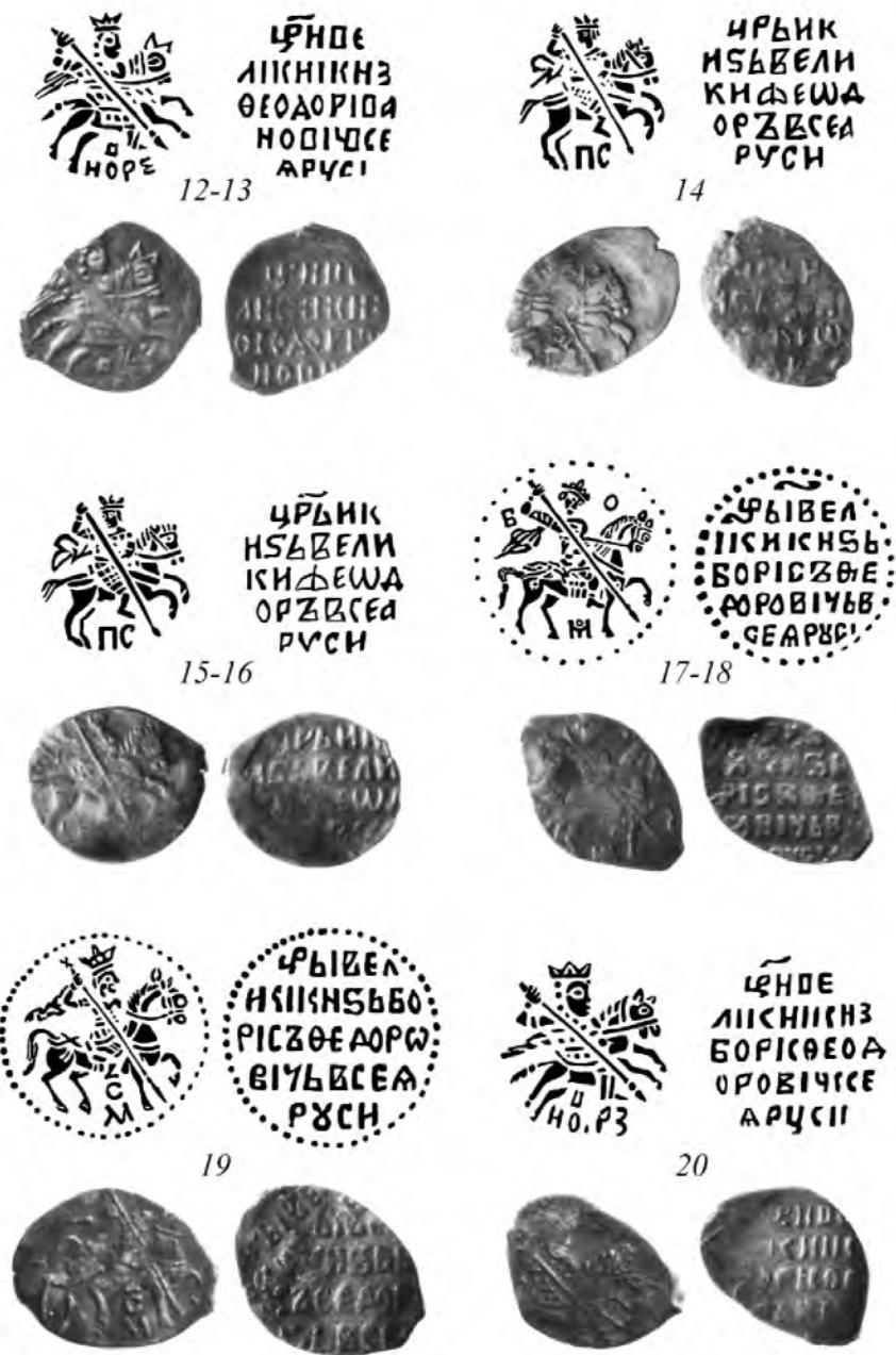
Рис. 3. Монеты из клада. № 12–20. Увеличено в 1,5 раза