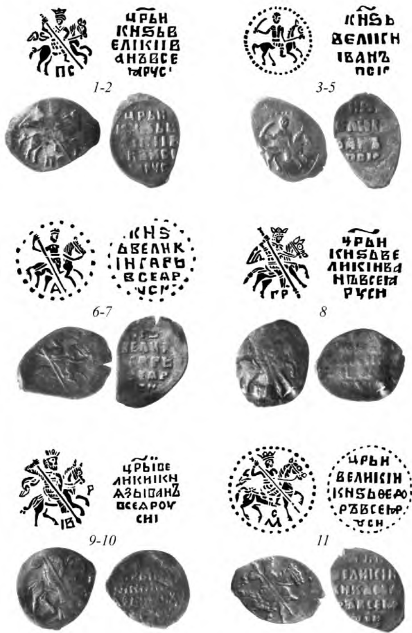
Рис. 2. Монеты из клада. № 1–11. Увеличено в 1,5 раза