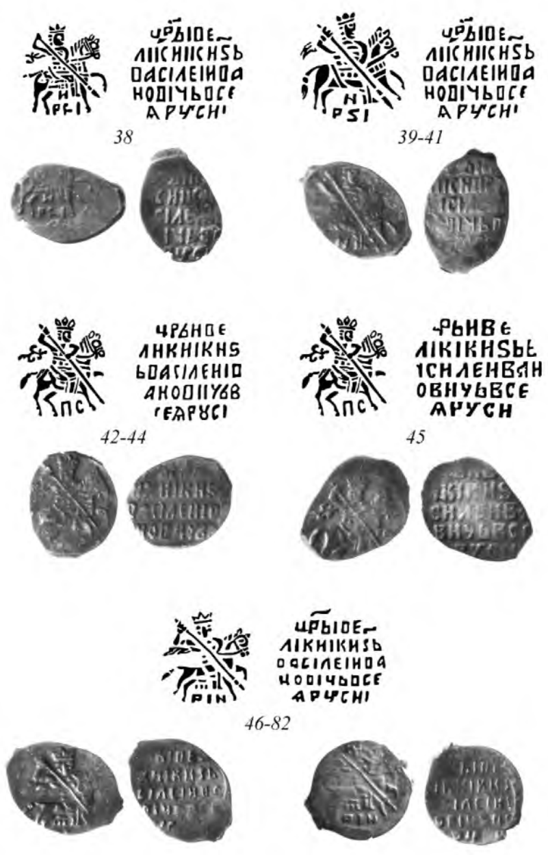
Рис. 6. Монеты из клада. № 38–82. Увеличено в 1,5 раза