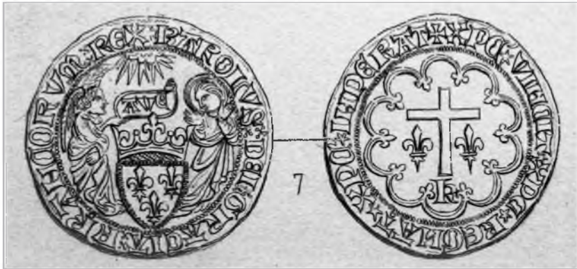
Рис. 5. Салодор. Карл VI