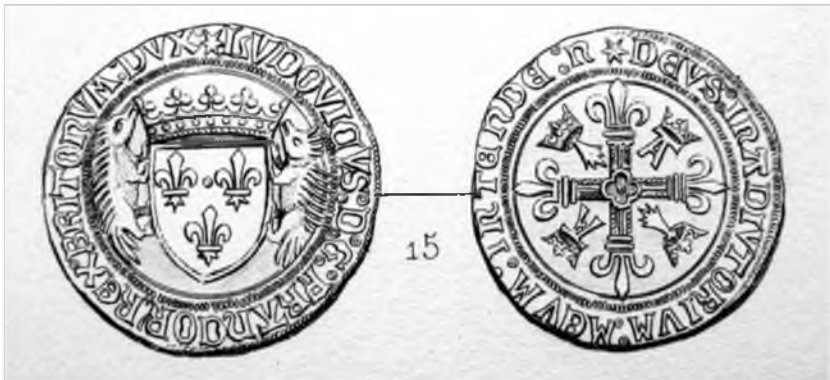
Рис. 6. Экю. Людовик XII