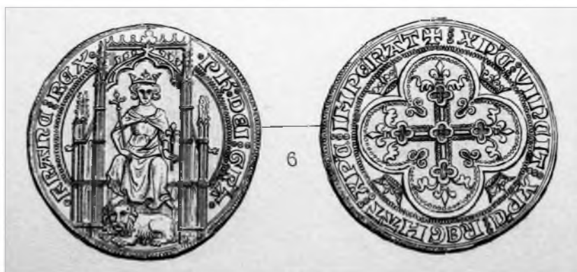
Рис. 4. Лиондор. Филипп VI