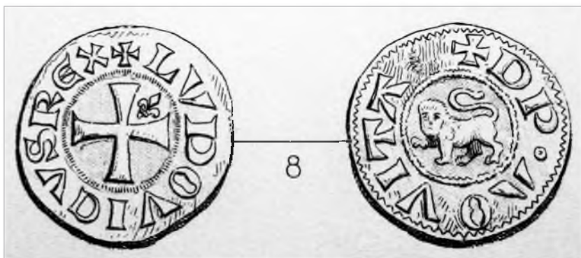
Рис. 1. Денье. Людовик VII

В тяжелые для Франции времена на королевских монетах значительно увеличивается количество геральдических элементов, выполняющих, видимо, прокламационную функцию. Мы видим и оформление притязаний на французский королевский престол, выраженный геральдическим языком, и агитационную борьбу, записанные и рассказанные геральдическим языком. И отражение этой борьбы на монетах, имеющих широкое хождение, — одно из свидетельств все возрастающего распространения геральдики.