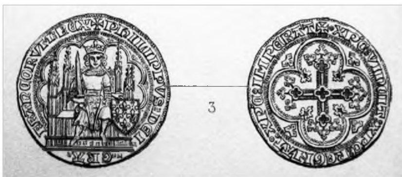
Рис. 3. Эку. Филипп VI