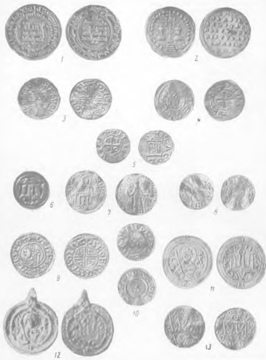
1 — саманидский дирхем 925/926 г.; 2 — Византия, Василий II и Константин VIII (976—1025), милиарсий; 3 — Англия, Этельред II (979—1016), денарий; 4 — Германия, денарий с именами Оттона III (983—1002) и Адельгейды; 5 — Германия, Кёльн, архиепископ Анно (1056—1075), денарий; 6 — полубрактеат Хедебу; 7 — Дания, Свен Эстридсен (1047—1075), денарий; 8 — Норвегия, Гаральд III (1047—1066), денарий; 9 — Швеция, Олаф Шётконунг (995—1022), денарий; 10 — Швеция, Анунд Якоб (1022—1050), денарий; 11 — Русь, Ярослав Мудрый (1015—1054), сребреник; 12 — подражание сребренику Ярослава Мудрого из Унна Сайва (Швеция); 13 — малый сребреник Ярослава (так называемое скандинавское подражание).