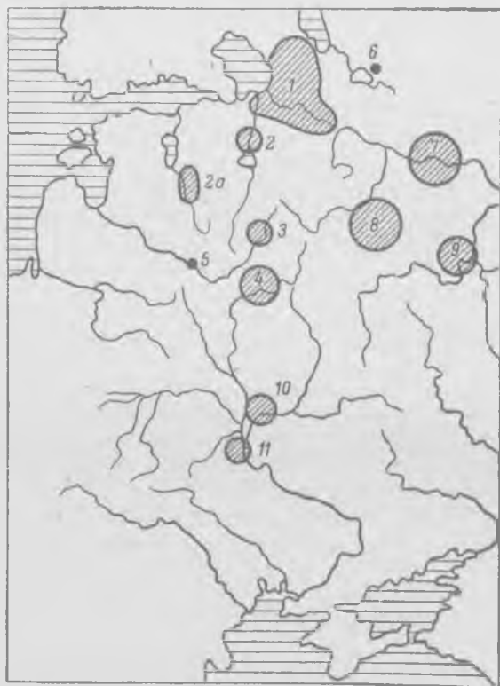
Карта 2. Археологические памятники Восточной Европы, в которых найдены скандинавские комплексы X—XI вв. и скандинавские вещи в культурном слое поселений X—XI вв.

т. е. больше, чем находил Т. Арне. Главный акцент в критике шведского ученого И. П. Шаскольский перенес с определения абсолютного количества варяжских комплексов на определение