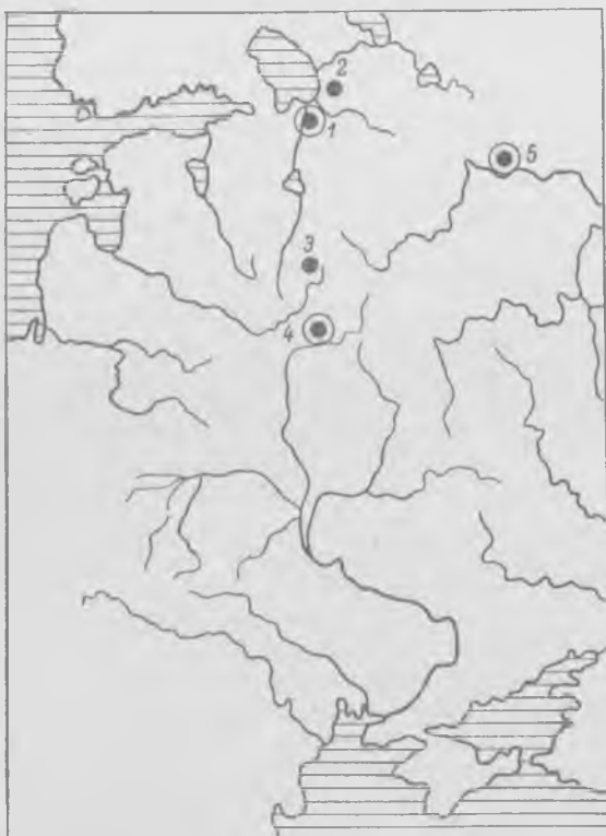
Карта 1. Археологические памятники Восточной Европы, в которых найдены скандинавские комплексы IX в.