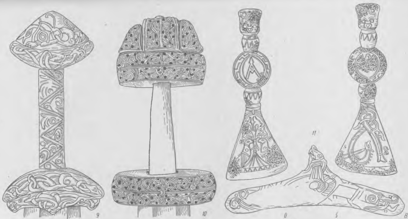
Таблица IV. Вещи смешанного русско-скандинавского стиля («гибриды»).

1 — маленькая скорлупообразная фибула, Юж. Приладожье, д. Крюково, кург. 18; 2 — арбалетная фибула, украшенная звериным орнаментом, Гробини; 3 — булава, Люцинский могильник, погр. 1, компл. 22; 4 — фибула, Гнездовский могильник, заготовка попоной фибулы с Рюрикова городища; 5 — декоративный топорик, Старая Ладога; 6 — гребень из Каино, 7, 8 — накладки луки седла, Шестовицы; 9 — рукоять меча из Фощеватой близ Миргорода; 10 — рукоять меча из Гнездовского могильника, раск. Д. А. Авдусина кург. 2; 11 — декоративный топорик, Владимирская область.