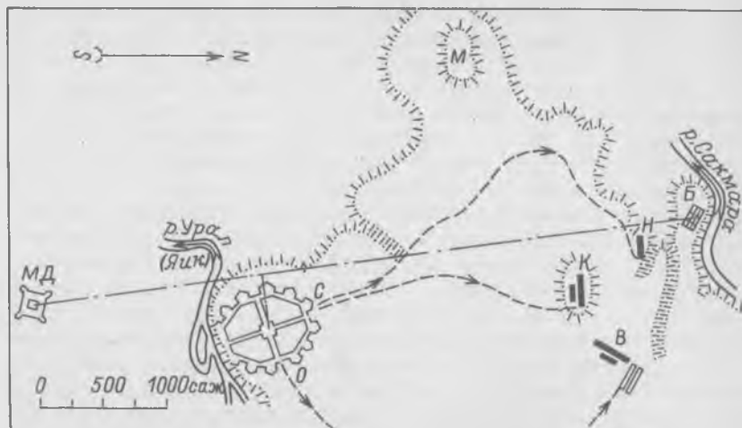
Рис. 3. Действительное расположение основных элементов топографической основы и вероятное расположение отрядов в «ордере баталии».

Такие существенные расхождения между двумя планами заставляют включить в анализ дополнительные материалы. Чтобы установить правильность нанесения топографических показателей и в зависимости от них определить расположение позиций, привлечены более ранние 13 и более поздние планы и выкопировки, 14 а также записи очевидца — губернского секретаря П. И. Рычкова, 15 ставшего первым членом-корреспондентом Петербургской Академии наук. Произведена и современная рекогносцировка местности. С учетом этого материала выполнен чертеж на рис. 3, где нанесено лишь самое необходимое. Чертеж повернут на 90° для удобства сравнения с другими планами. Ориентировка позиций В, К, Н произвольна.