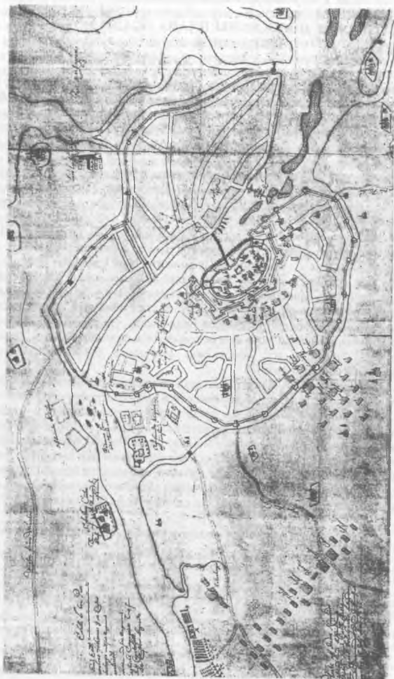
Рис. 1. План осады Новгорода шведами в 1611 г.