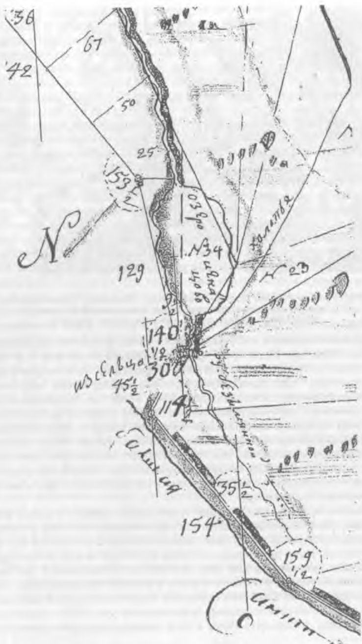
2. Фрагмент плана дачи сельца Великий Двор с изображением озера Игнатцова