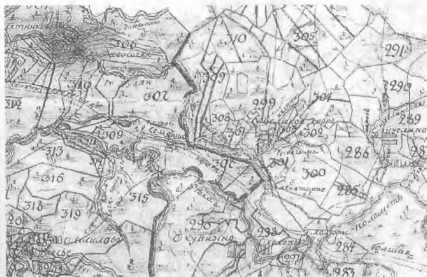
1. Округа селыя Великий Двор на планах-атласах Крестецкого (левая половина) и Валдайского (правая половина) уездов Новгородской губернии. (Изображение на двух планах совмещено путем монтажа)