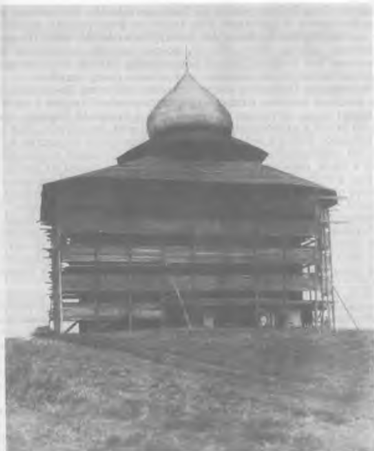
Рис. 11. Церковь Спаса на Нередице. Вид с юга. Снимок 1919—1920 годов. Фототека ИИМК. П. 7202.

сколько это могло повредить фрескам, а ограничиться прочисткой швов от цемента специальными металлическими щетками и зубилами. Удаление цементной штукатурки производилось осторожно, в два приема. Обнажившаяся кладка стен и барабана была тщательно замерена, сфотографирована и зарисована (сделано 127 снимков и 29 чертежей), 102 после чего покрыта известковой обмазкой без цемента с песком и побелена. Хотя архивные документы не сообщают о переделке декоративного «византийского карниза» и в докладе П. Покрышкин не касается этого вопроса, но из более поздних публикаций и фотографий становится ясно, что карниз во время ремон-