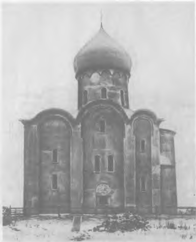
Рис. 10. Церковь Спаса на Нередице. Вид с юга. Снимок 1904 г. После реставрации. 0.627.37.

пичного парапета над восточными закомарами трех фасадов архитектор допустил некоторое отступление от принципов научной реставрации (для восстановления этих элементов не было достаточных данных). Наконец, в упрек реставратору ставилось уничтожение им притвора XVIII в.