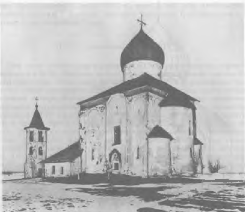
Рис. 7. Церковь Спаса на Нередице. Вид с юго-востока. Снимок 1896 г. (?) 0.623.2.

шей во все обобщающие труды и учебники по русскому искусству, истории и теории древнего зодчества, восстановлению памятников культуры.