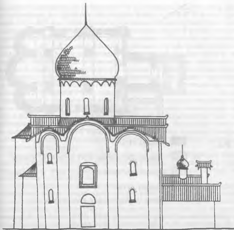
Рис. 2. Вид храма после перестройки. Середина XVI в.

апостола 1527 г., Успения в Колмове 1528 г., Бориса и Глеба в Плотниках 1536 г. и др.) и иконографические источники. 35