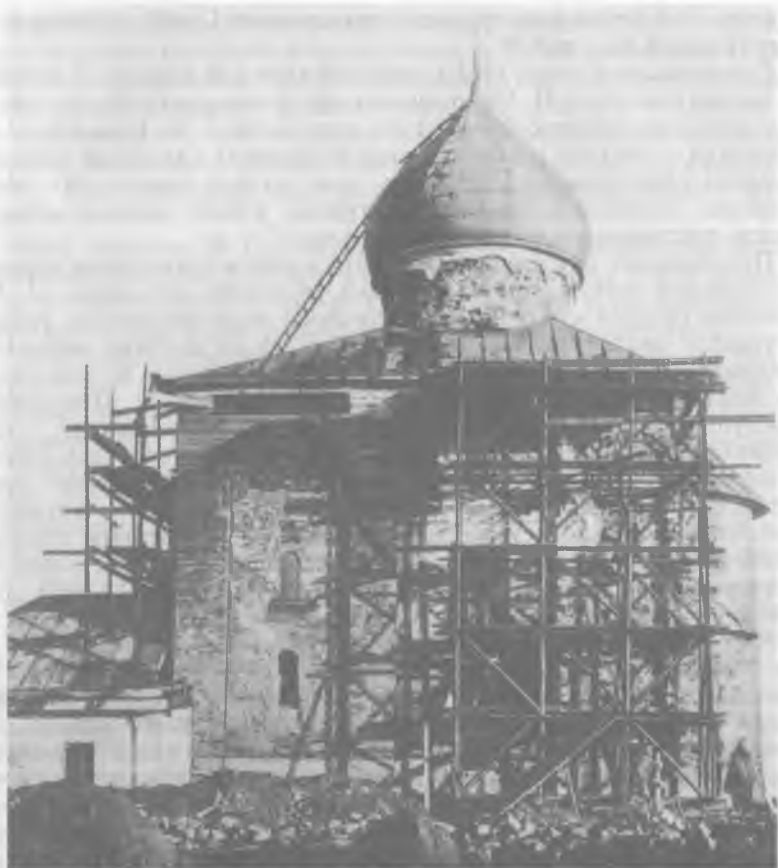
Рис. 8. Церковь Спаса на Нередице. Вид с юга. Снимок 1903 г. 0.627.9.

хорах и на внутренней лестнице; 90 12) отремонтирована колокольня; эта работа не нашла отражения в документах и отчете П. Покрышкина, но сравнение дореволюционных фотографий, снятых до и после ремонта, позволяет сделать такой вывод.