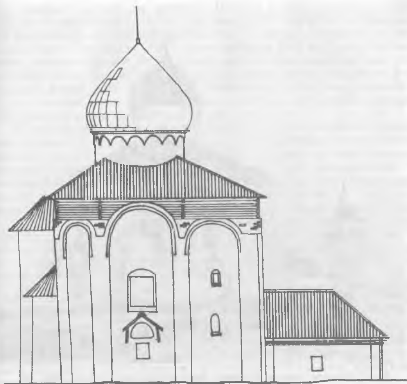
Рис. 6. План с папертью XVIII в. Рисунки выполнены И. А. Ракитянской.