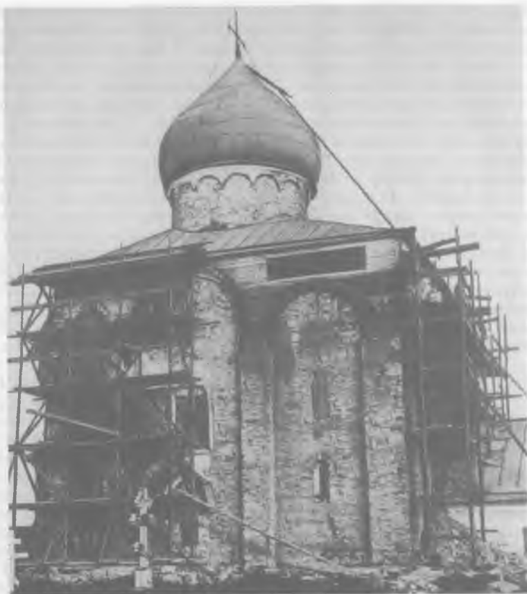
Рис. 9. Церковь Спаса на Нередице. Вид с севера. Снимок 1903 г. 0.627.7.

рации. Однако несколько известных архитекторов и художников (среди них А. В. Щусев, Н. К. Рерих, И. Э. Грабарь) выступили с критикой, указывая на некоторые ошибки, допущенные реставратором. С точки зрения современной теории, главной ошибкой является широкое применение цемента. Это можно объяснить только тем, что распространенный в начале XX в. строительный материал еще не был достаточно изучен и его отрицательные свойства не были известны. Второй недостаток работы П. Покрышкина в том, что он не вполне четко осознавал необходимость максимального сохранения подлинных материалов и форм для исторической ценности памятника. Это обусловило крупные перекладки и замену облицовки новым кирпичом на цементном растворе (особенно на южном фасаде), что в определенной степени снизило художественные достоинства храма. Кроме того, при устройстве карниза четверика и кир-