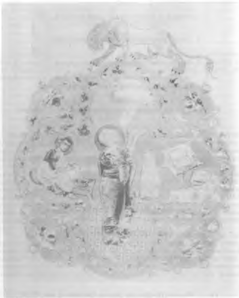
Рис. 2. Остромирово Евангелие. Евангелист Иоанн, л. 1 об.

дует учитывать, что в Константинополе в XI и XII вв., а возможно, и ранее действовали мастерские, где не только на заказ, но и на рынок изготовлялись на отдельных листах миниатюры для разных, в разных местах составляемых рукописей. О. С. Попова метко уловила, что в миниатюре с изображением евангелиста Иоанна видно «стремление уподобить лист с миниатюрой великолепному дворцовому изданию». 6 Но в таком случае позволительно предположить, что мини-