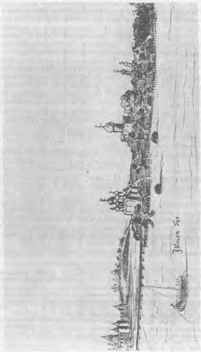
Рис. 3. Рисунок «Великий Новгород» с изображением Николо-Дворищенского собора из альбома Мейсберга. 1661—1662 гг.