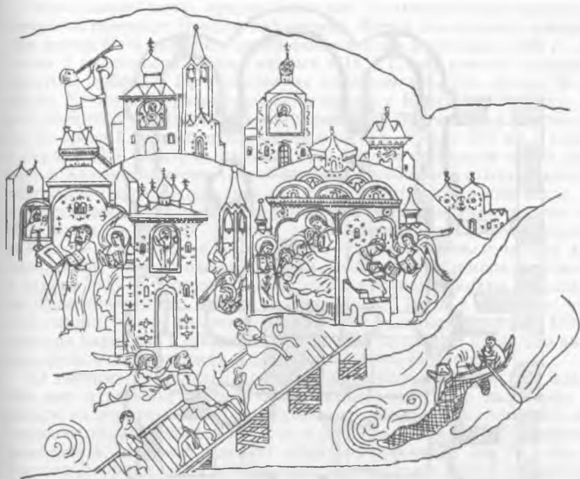
Рис. 1. Икона «Видение пономаря Тарасия», кон. XVI — нач. XVII в. Фрагмент прориси П. Л. Гусева с изображением Николо-Дворищенского собора с северным приделом.

ми, возможно, являлось северной папертью, сведения о которой содержатся в Описи 1617 г.