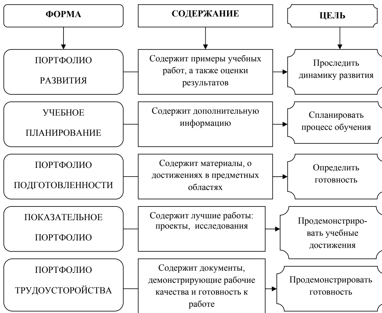
Рис. 4. Типология портфолио на основании целей использования

В нашем случае, портфолио студента для государственной итоговой аттестации интегрирует в себе все названные цели и, следовательно, в структуре портфолио должно быть отражено содержание названных типов портфолио, возможно, в качестве разделов.