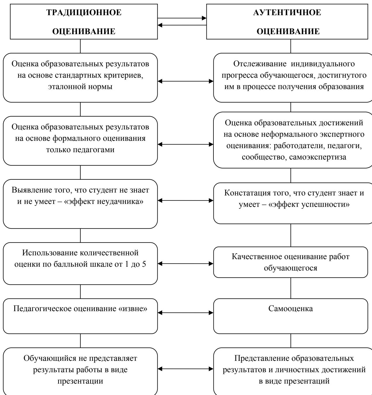
Рис.1. Сравнительный анализ традиционного и аутентичного оценивания