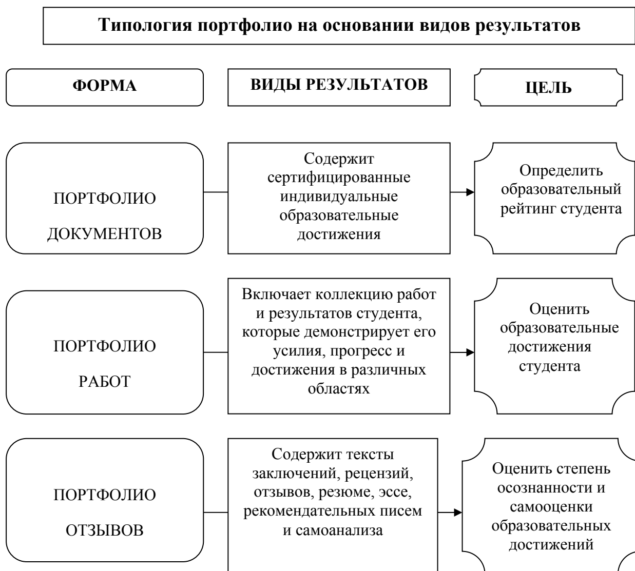
Рис.5. Типология портфолио на основании видов результатов

Представляется в виде текстов заключений, рецензий, отзывов, резюме, эссе, рекомендательных писем и прочее.