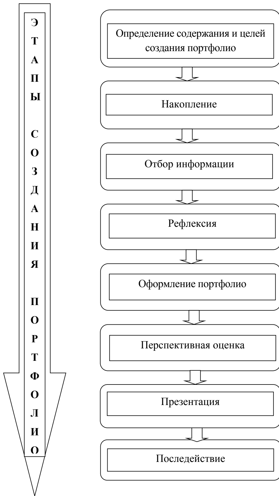
Рис. 6. Этапы создания портфолио