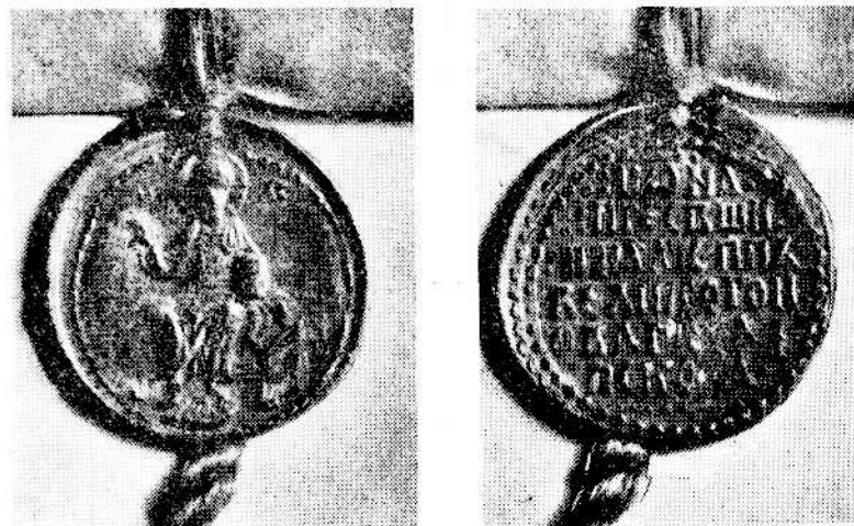
Печать архиепископа Ионы (1458—1470 гг.).

Печать Симеона (1416—1421), известная в одном экземпляре, дошедшем при грамоте этого владыки в Ригу, имеет изображение не Богоматери, а благословляющей руки и не строчную, а круговую надпись в иной формуле, притом—единственная из печатей до 1478 года — она отлита не в свинце, а в воске 14 . Печати, дошедшие при грамотах Евфимия II (1434—1458), все принадлежат к виду анонимных. С именем этого владыки известна одна печать, несковская, содержащая изображение не Божьей Матери, а эмбле-