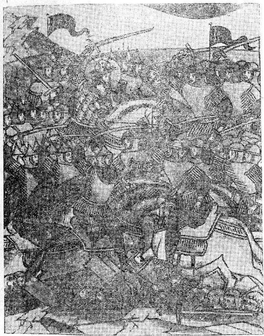
Рис. 6. Бой на льду Чудского озера (миниатора из Ладтевского летописца, XVI в.).

Немецкие агрессоры получили от великого русского народа такой сокрушительный удар, что надолго оставили свои замыслы о захвате русской земли. Современные фашистские каннибалы объявляют крестоносцев своими прямыми предтечами.