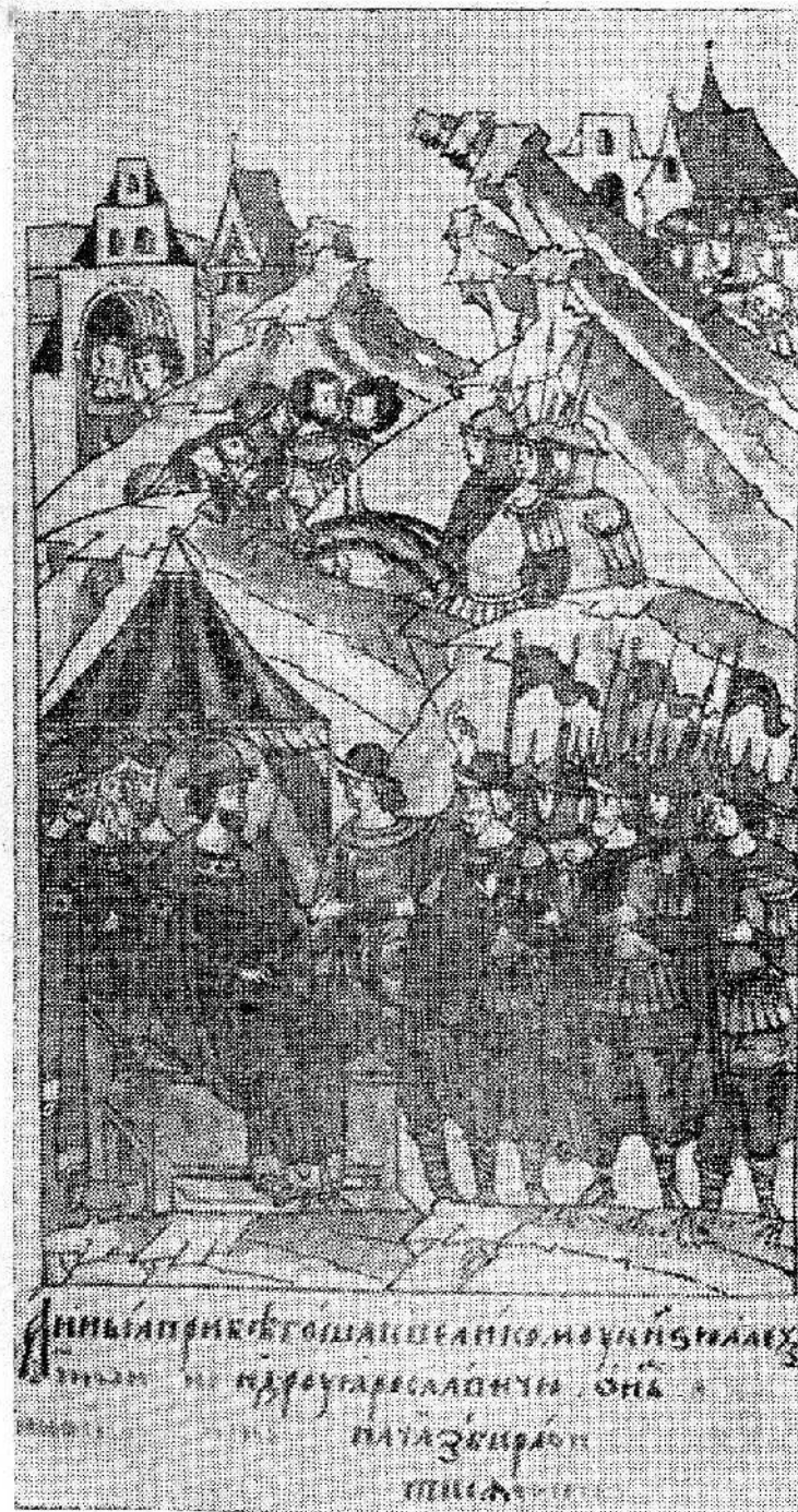
Рис. 2. Князь Александр Невский собирает войска в поход против немцев (миниатора из Лантевского летописца. XVI в.).