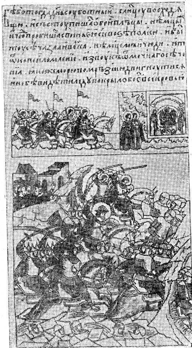
Рис. 7. Разгром немецких „псов-рыцарей“ на льду Чудского озера (миниатюра из Далгевского летописца, XVI в.).

На это мы ответим словами товарища Сталина, сказанными им на XVII Партсъезде: