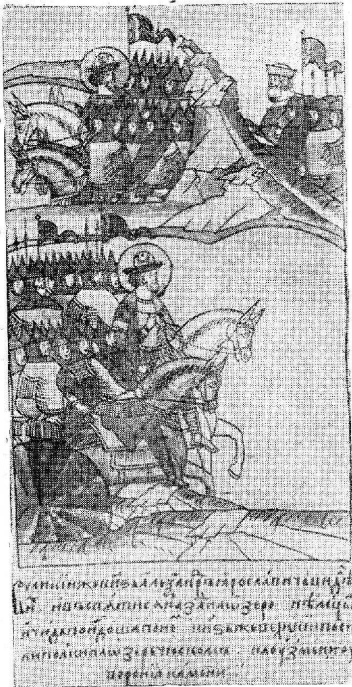
Рис. 3 Русские войска на льду Чудского озера (миниатюра из Лаптевского летописца, XVI в.

И в другом месте летописец говорит: „Они же горди совокупишася и реша: „пойдем, победимъ великаго князя Александра и имемъ его руками“ 1) ).