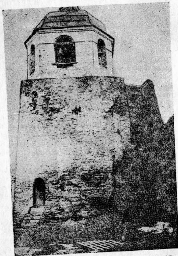
Порхов. Никольская башня (1387—1430 г.); со стороны двора крепости

гранная колокольня. Проезд под Никольской башней в древности не приводил непосредственно вовнутрь крепости. Пройдя под башней, проходили узким коридором между двух стен: основной и дополнительной, закрывавшей вторые ворота, расположенные в основной стене в нескольких десятках метров к северу от башни.